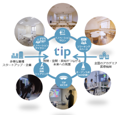
多様な業種・業界の 企業・スタートアップとの 異分野連携増強のための仕組み 「TMDU イノベーションパーク(TIP)」

その他、実験機器を時間単位で利用できる『機器シェアリング』や共同研究を行う会員様に限り『TIP オープンラボ』の利用や、試作検証、3D データ加工・設計・収集、仮想空間検証、遠隔医療等の設備を時間貸しできる『イノベーションXRラボ』を整備しております。